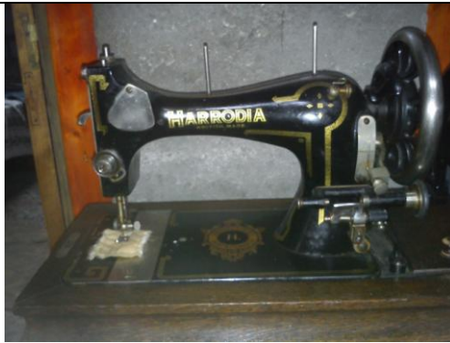
MÁQUINA DE COSER MARCA HARRODIA FABRICADA EN LONDRES POR LA COMPAÑÍA HARRODS. EDICIÓN LIMITADA. AÑO DE FABRICACIÓN 1917 aprox.