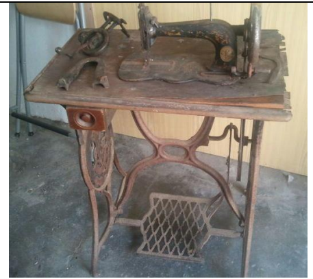
SINGER DE COLECCIÓN Nº DE FABRICACIÓN:1811910 AÑO DE FABRICACIÓN:1874 MUY POCAS UNIDADES

Se caracteriza por su forma de violín en la base. Lanzadera de media bellota.