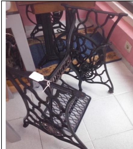
PIE SINGER, BIELA MADERA CON UNA ANTIGÜEDAD DE MAS DE 100 AÑOS