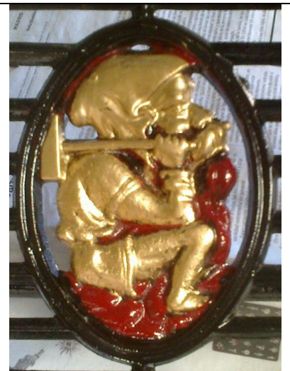
ANTIGUO LOGO DE WERTHEIM