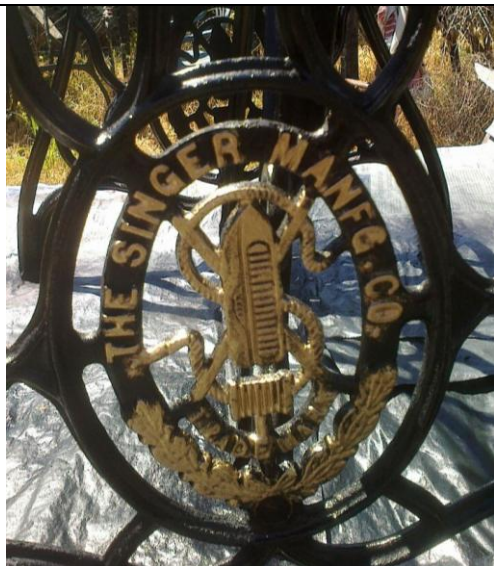
ANTIGUO LOGO DE SINGER